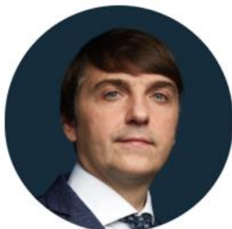
Кравцов Сергей Сергеевич

Министр просвещения Российской Федерации